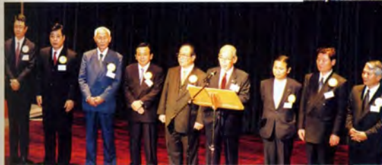
ドイツ大会・かせだナイトでの 県議会海外行政視察団一同のあいさつ