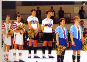
サイクルサッカーグループA表彰式