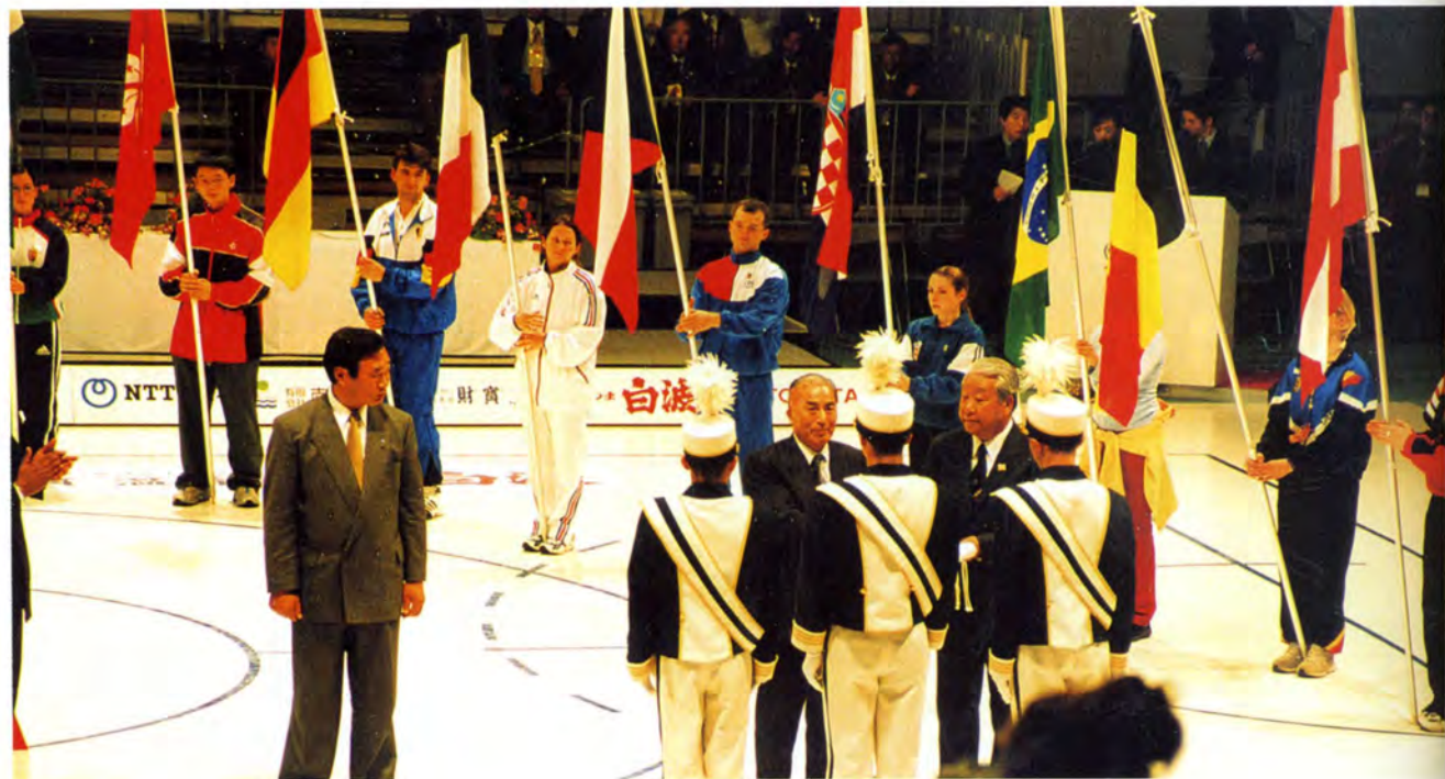
UCI旗の引き継ぎセレモニー