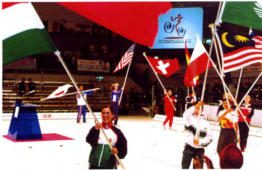
参加国・地域旗入場