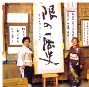
ふれあいギャラリーいしくらでの書の展示