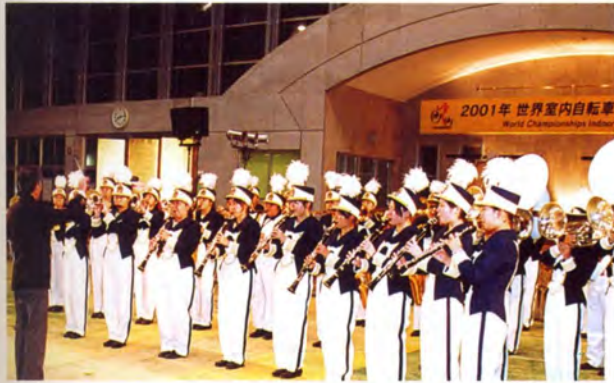
歓迎演奏 (鳳凰高校吹奏楽部)