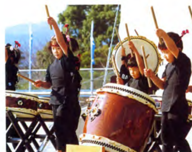
ステージショー (南さつま太鼓祭り)