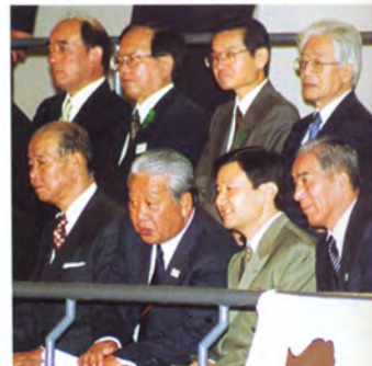
サイクルサッカー競技をご観覧