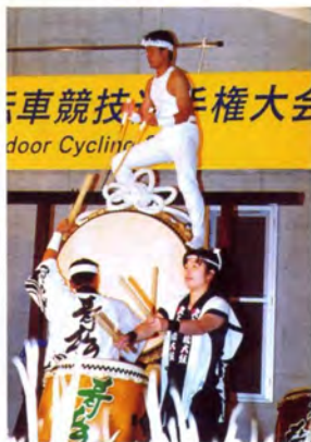
アトラクション太鼓演奏 (吹上青松太鼓)