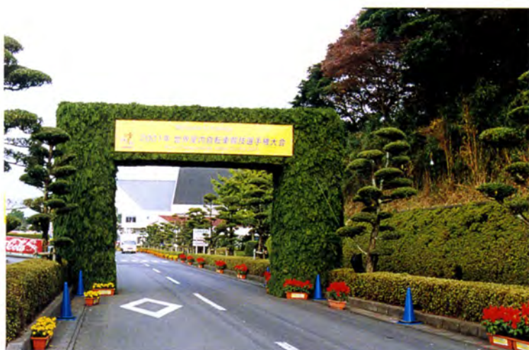
市民手づくりの緑門（ウエルカムアーチ）