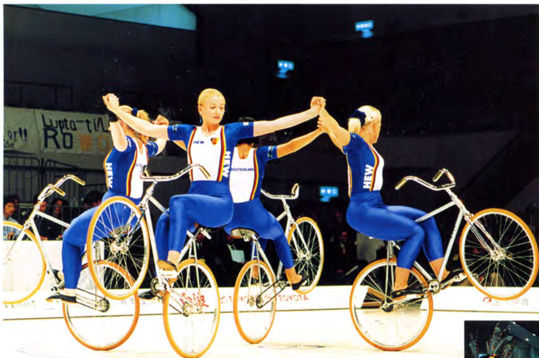
サイクルフィギュア女子4人制の華麗な演技