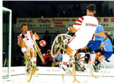
ゴール際での攻防 (サイクルサッカーグループA)