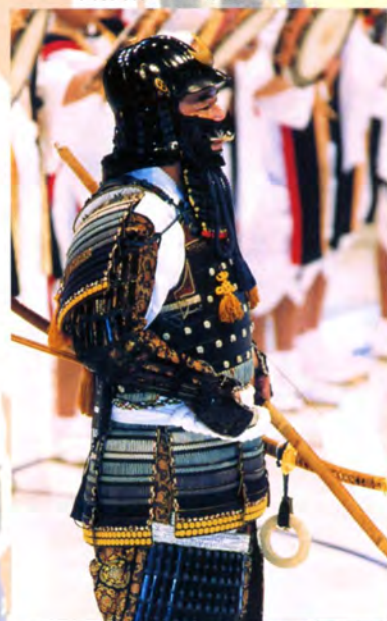
甲冑武者による歓迎の口上