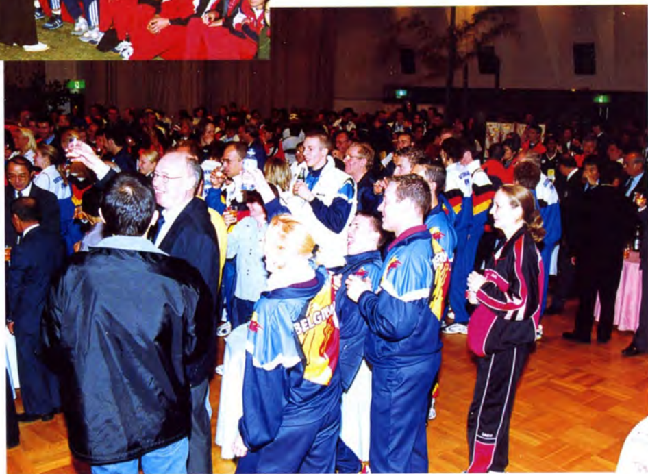
大会の成功を祈り乾杯