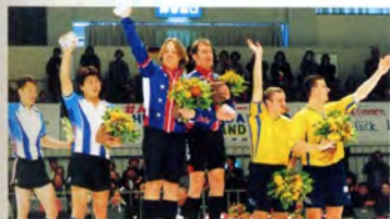
サイクルサッカーグループB表彰式 (1位アメリカ/2位日本/3位ルーマニア)