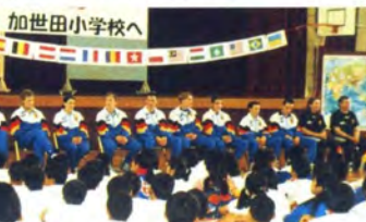
ドイツジュニアチームと加世田小学校児童が交流