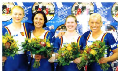
サイクルフィギュア女子4人制表彰式 (1位のドイツチーム)