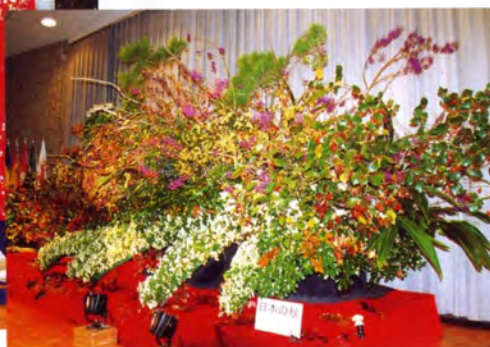
市民手づくりの歓迎オブジェ