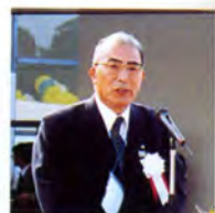
主催者あいさつ (加世田市市長)