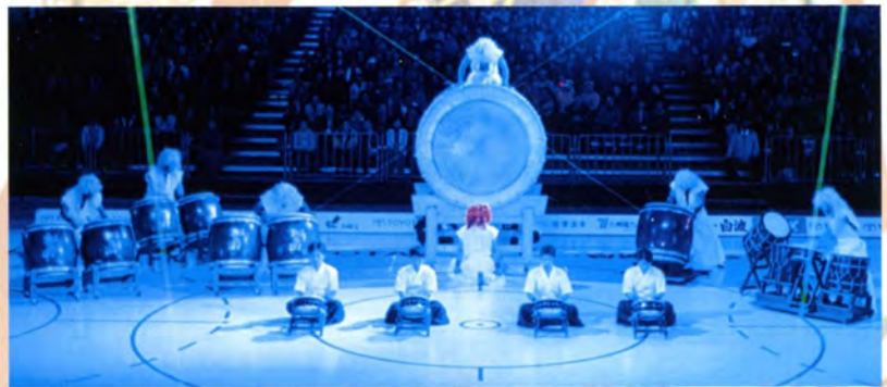
弥五郎太鼓とレーザーによる幻想的な演出