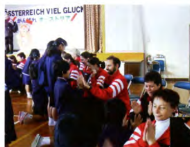
各国選手たちとの交流