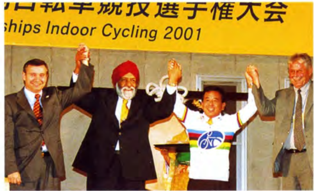
UCIから大会功労者への記念品贈呈 (本坊実行委員会副会長)