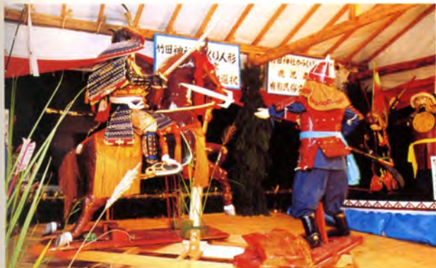
竹田神社前に水車からくりを展示