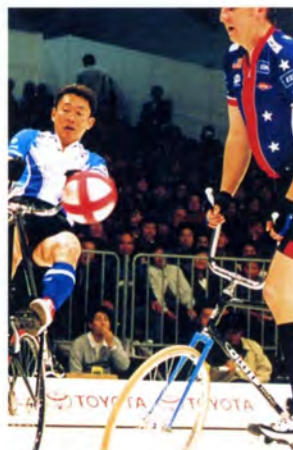
サイクルサッカーグループB (日本VSアメリカ)