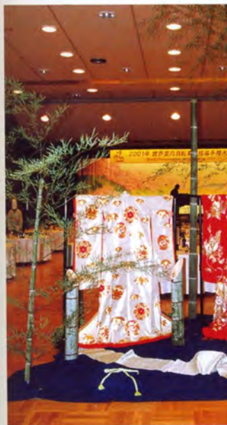
大ホールに飾られた歓迎オブジェ