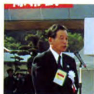
開式あいさつ (加世田市収入役)