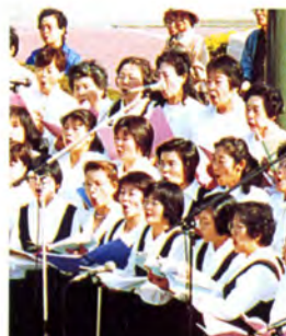
地元コーラスグループによる合唱