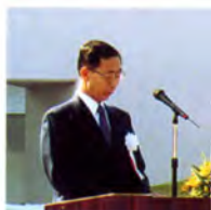
主催者あいさつ (日本宝くじ協会業務部長)