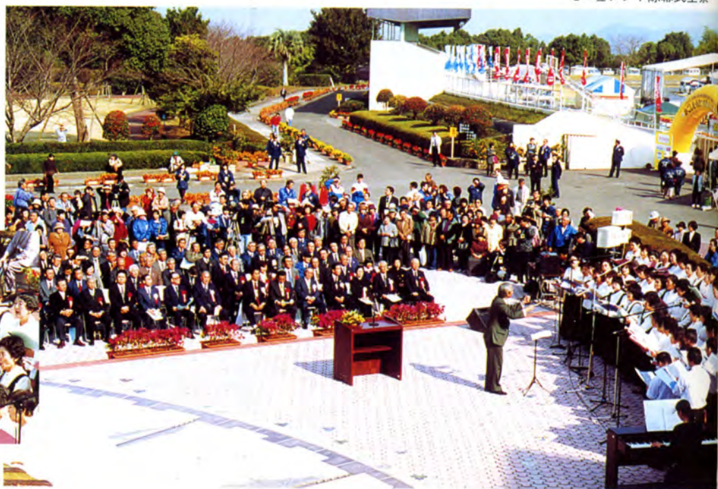
モニュメント除幕式全景