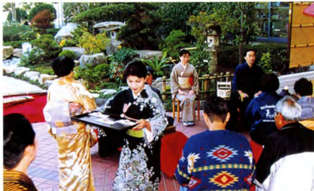
野点 (競技会場入口)