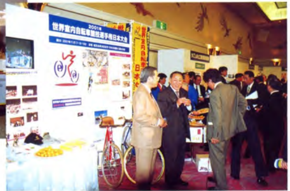
各所で世界大会のPR活動を展開（鹿児島のタベ・東京プリンスホテル）