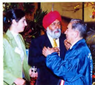
ダトーUCI理事と川野市長