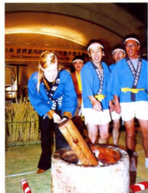
加世田青年会議所による餅つきも大好評