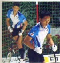
ドイツ大会（ポプリンゲン市）に 現王園、手島選手が出場