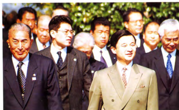
大会会場周辺をご視察