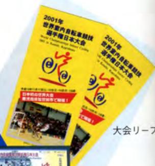
大会リーフレット