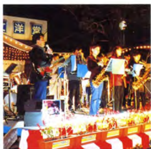
ナイトコンサートが華やかにスタート