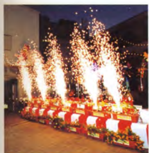
ゆめぴか本町ステージで 様々な催しが開催