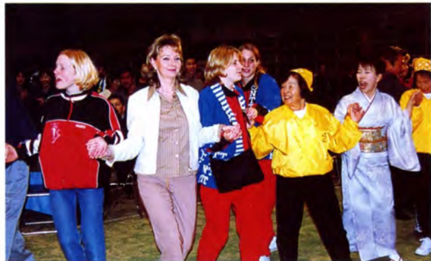
みんな笑顔でフォークダンス