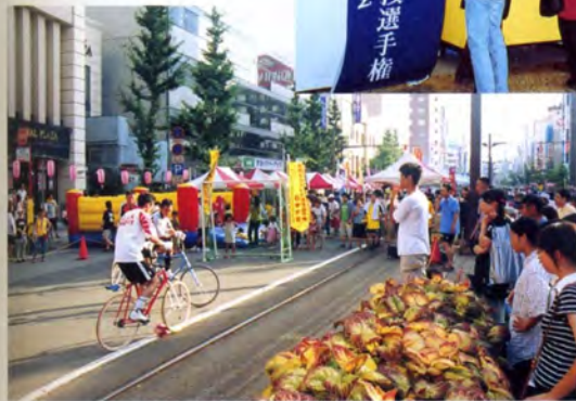
かせしま夏祭り2001での街頭PR（鹿児島市・天文館通り）