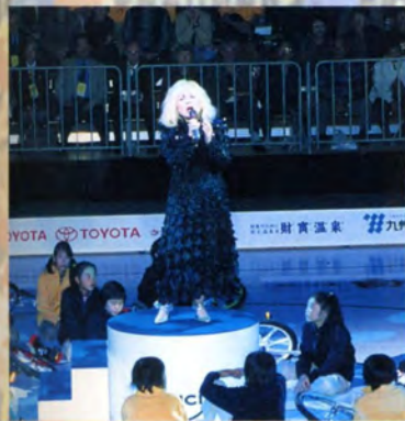
アメージンググレースの独唱