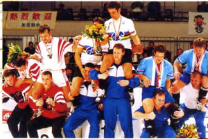
盛り上がるサイクルサッカーグループAの表彰