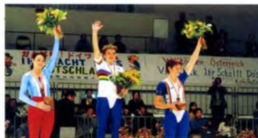
サイクルフィギュア女子シングル表彰式