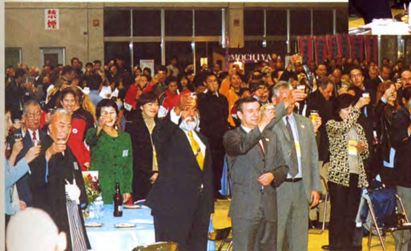
大会の成功を祝して乾杯