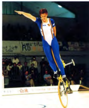
サイクルフィギュア女子シングル演技 (ドイツチーム)