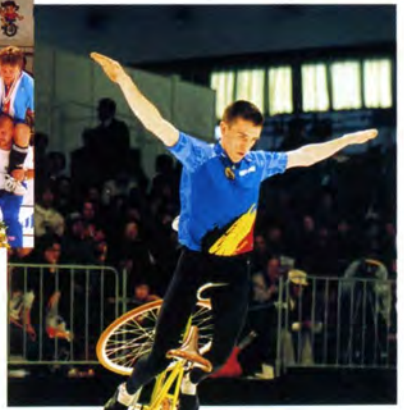
サイクルフィギュア男子シングルの演技