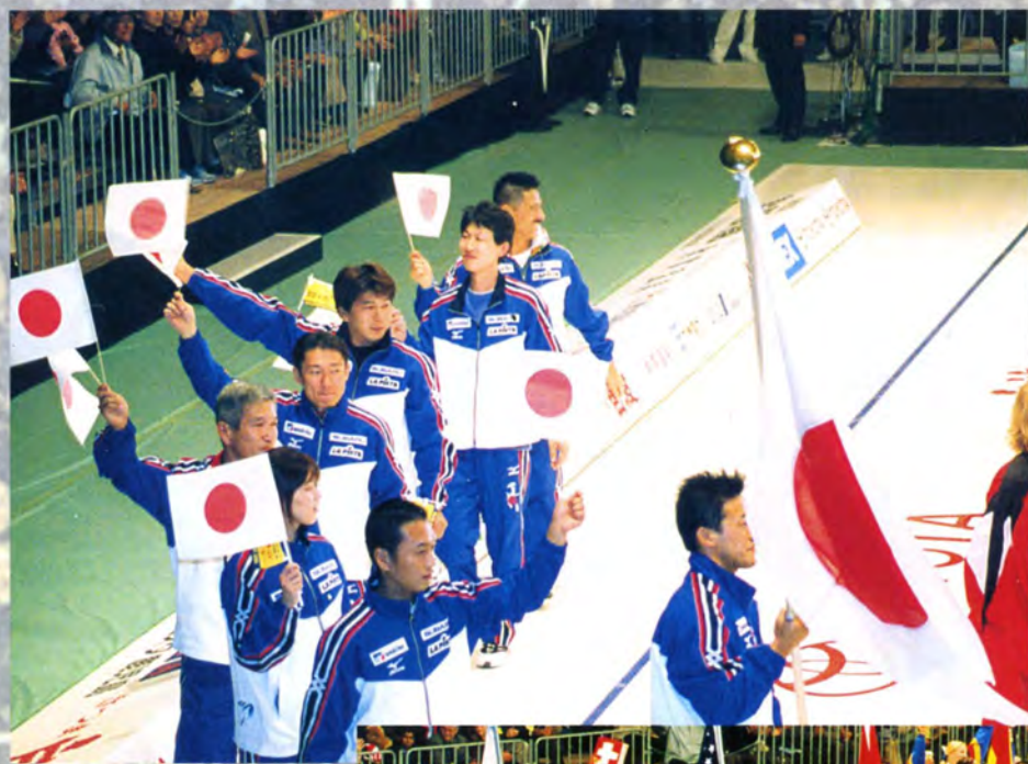
日本チームの入場