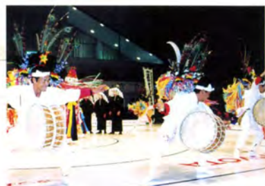
幕間のアトラクション (津貫中間豊祭太鼓踊り)