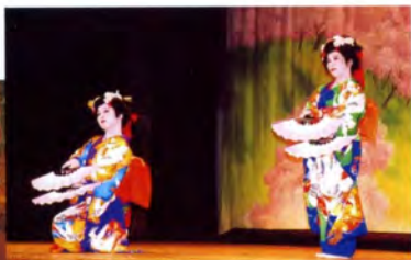
日本舞踊で艶やかに開会