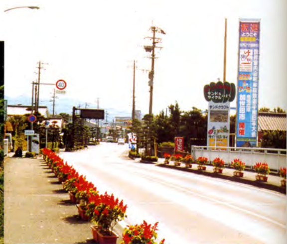
花いっぱい運動による沿道の装飾