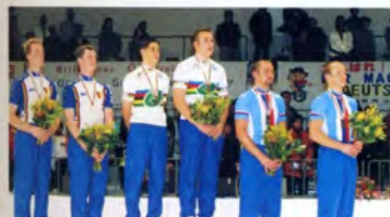
サイクルフィギュア男子ペア表彰式