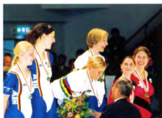
サイクルフィギュア女子ペア表彰式