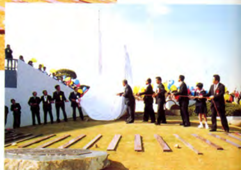
モニュメント除幕の瞬間