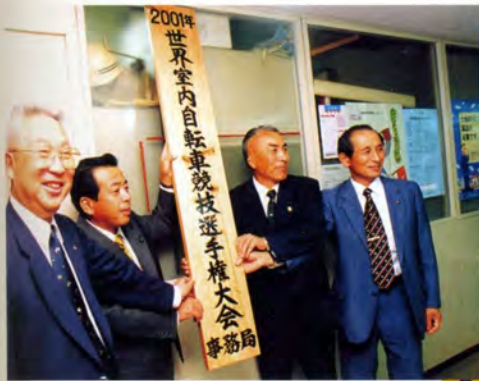
市役所に大会事務局を設置