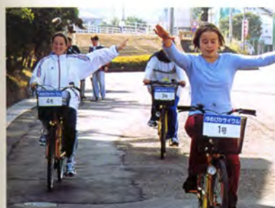
レンタサイクルも大活躍