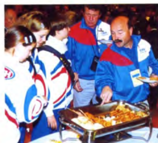
初めての日本食に舌鼓