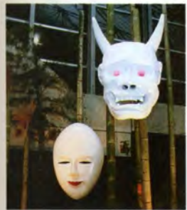
日本らしさを演出