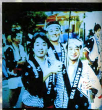
オープニング~かせたスマイル~