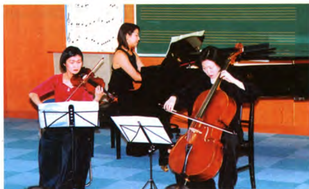
万世小学校での演奏