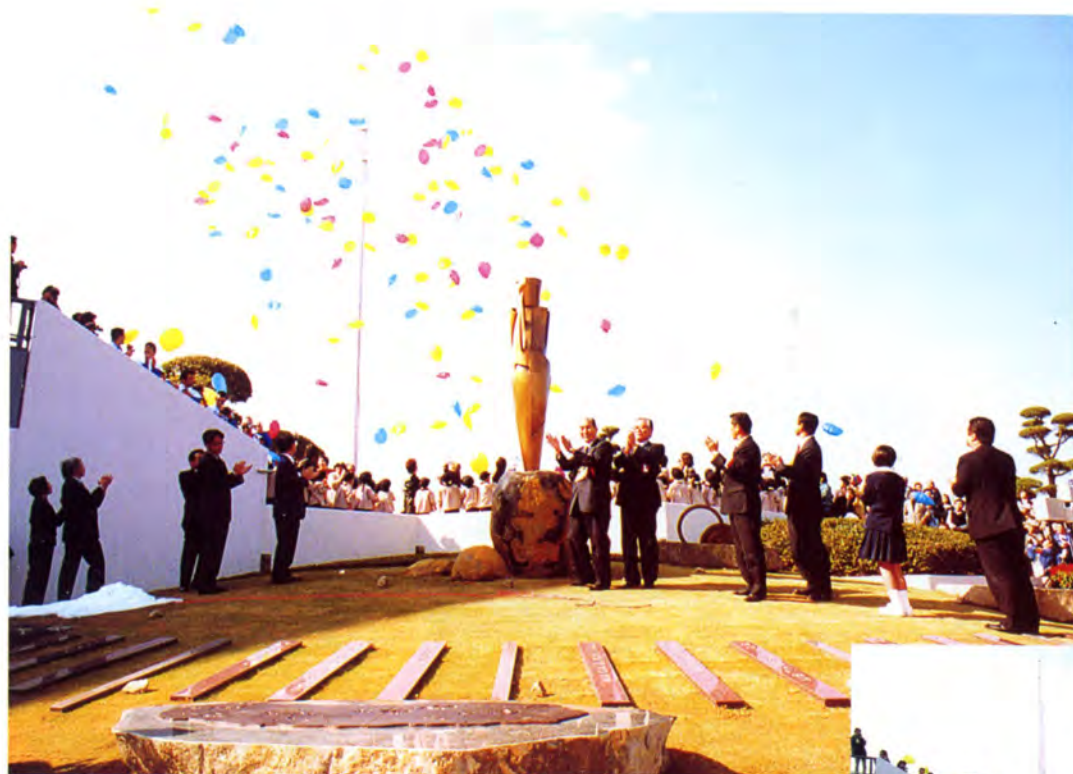
大会開催記念モニュメント像全景 (デザイン: 茶園勝彦氏)