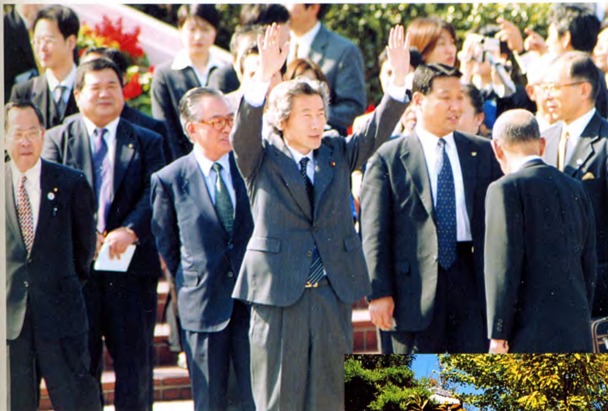
市民の歓迎に笑顔で応える小泉総理大臣