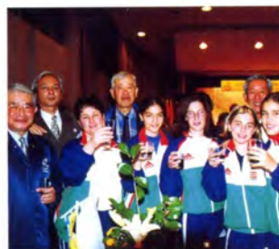
応援国と顔合わせ