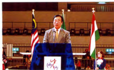
閉会のあいさつ (組織委員会会長)