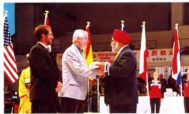
次期開催国オーストリアへUCI旗を引き継ぎ