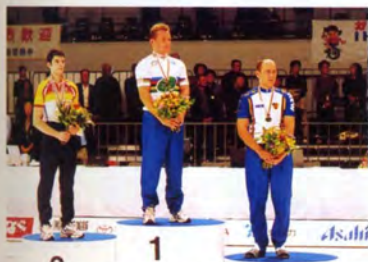
サイクルフィギュア男子シングル表彰式