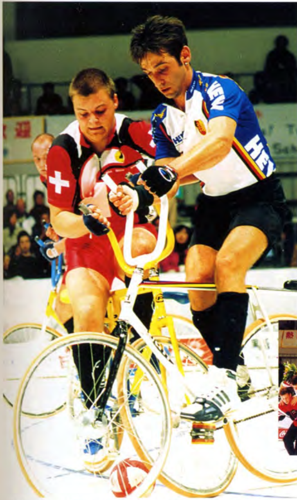
白熱するサイクルサッカーグループAの競技 (ドイツVSスイス)