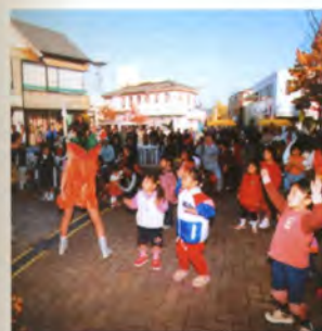
盛り上がったぼよばらダンサーズ