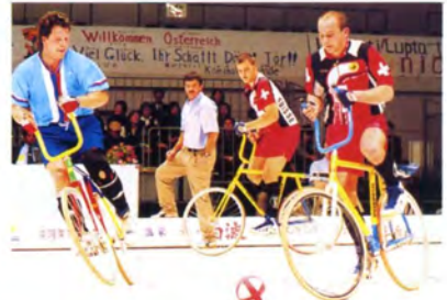
スピーディなパスワーク