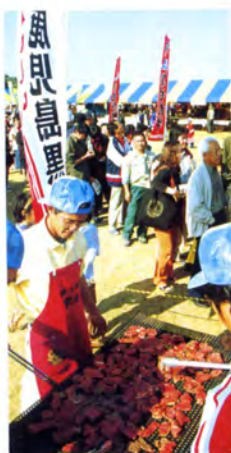
おいしい安全なかせだ牛をPR