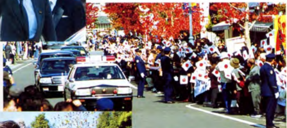
沿道での歓迎風景