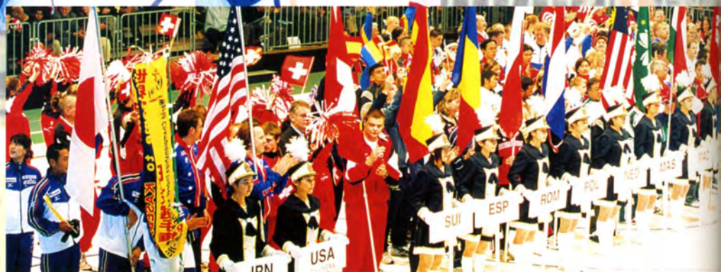
ブラカーダー (鳳凰高校) を先頭に、各国チームが整列