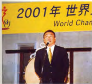
特別ゲストあいさつ (中野浩一氏)