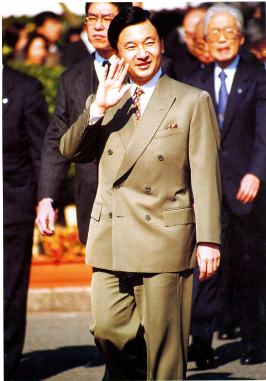
市民の歓迎に応えられる皇太子殿下