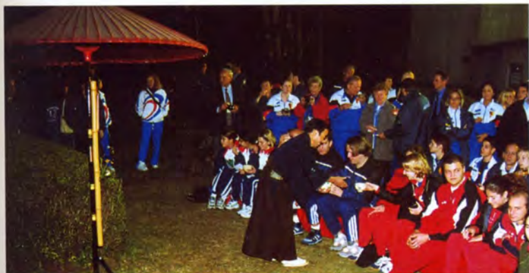
屋外で催された野点に選手も感激