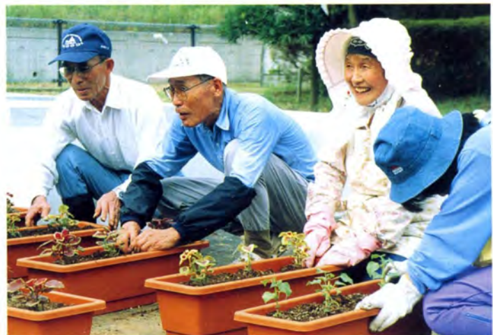
市民による花いっぱい運動（フラワーポット作り）