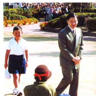
加世田市身体障害者スポーツ大会をご視察