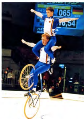
サイクルフィギュア男子ペア演技 (ドイツチーム)