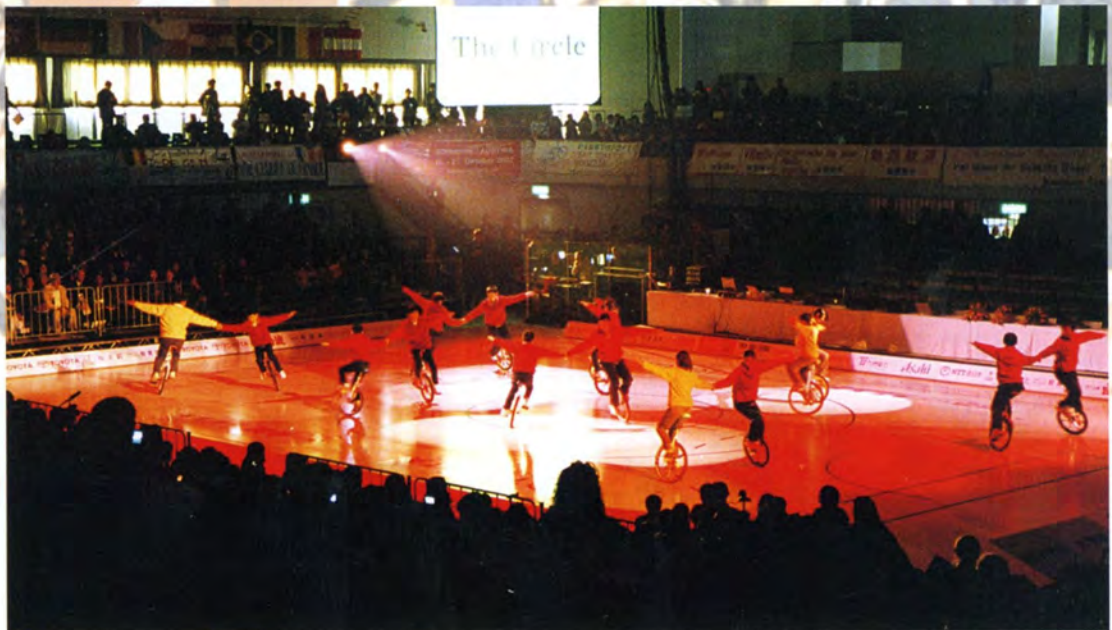
地元小学生による一輪車集団演技