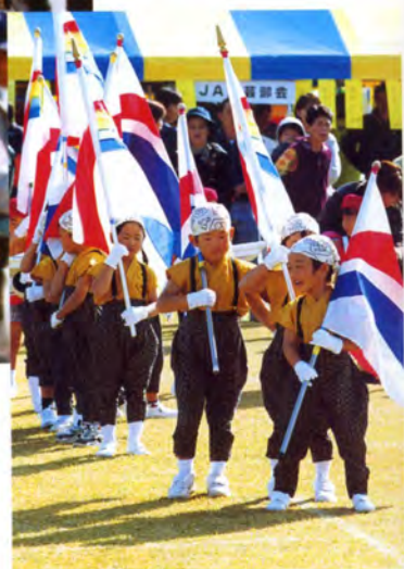
園児たちの元気な演技