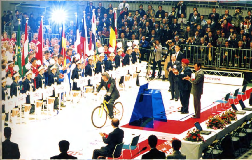
披露された小泉号に乗る小泉総理大臣