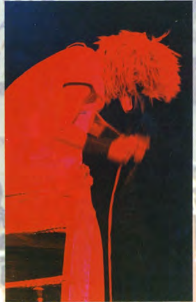
アトラクション (弥五郎太鼓)