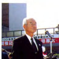
閉式あいさつ (加世田市教育長)